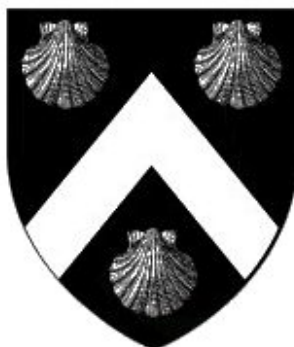
La Woestine (La Vostine) ou la branche de La Clite Commine de La FLANDRE