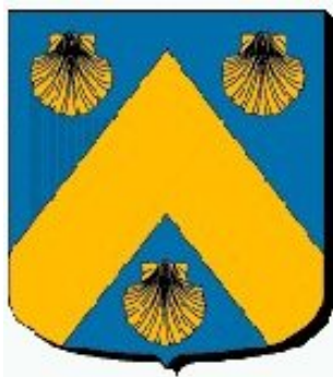
Maffliers commune de Val d'Oise et « de FOMBERT » (Bourbonnais)

Nous pouvons noter diverses ressemblances (au niveau des meubles) :